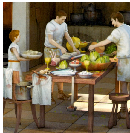
Reconstitution d'une domus