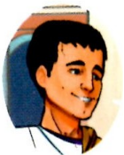
(Aristote, Éthique à Nicomaque , I, 1098a / Érasme, Adages , 694)

Μία χελιδὼν ἕαρ οὐ ποιεῖ οὐδὲ μία ἡμέρα. una hirundo non facit ver neque una dies